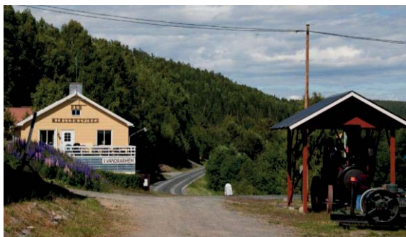
Mjällomsvikens vandrarhems kök lånades ut till Skogsstyrelsen