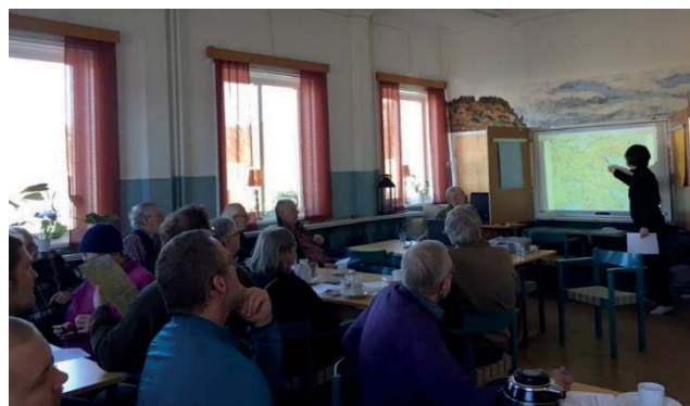
Stor uppslutning på skötselträffen i Sockenstugan