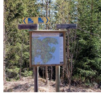
Extra kartor bl.a. vid Höglintens parkering