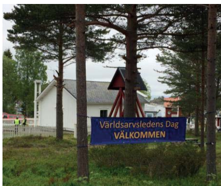
Världsarvsledens Dag 2017 i Bönhamn

Dagen blev omskriven i Nordsverige och Kramforsbladet. Vi fick god hjälp med utformning av affisch och vi affischerade i bygden och annonserade om arrangemanget på vår hemsida, på nordingra.nu och på Kramfors kommuns hemsida. Vi sponsrades av flitig skribent med en helsidesannons i tidningen Collage.