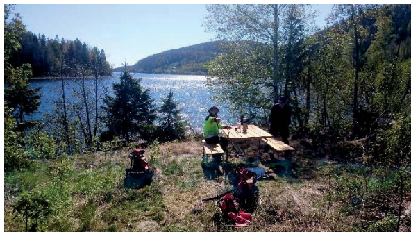
Skidstahus virke har bl.a. använts till ett rastbord vid Edsätterfjärden

VINSTER TILL VÄRLDSARVSLEDENS DAG SKÄNKTES AV: