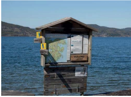
Informationstavlorna kontrollerades, här Mjällomsländans